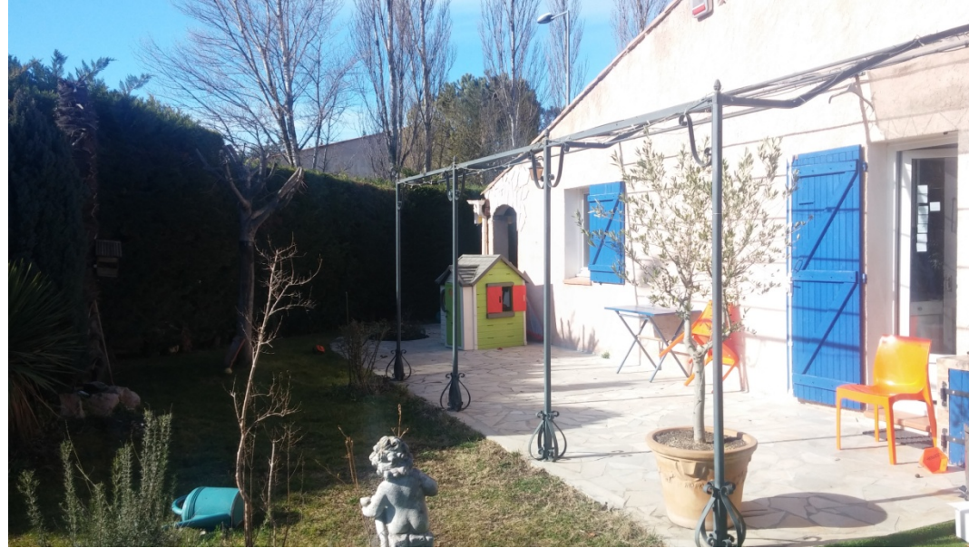
Maison N°4 Vue de la piscine