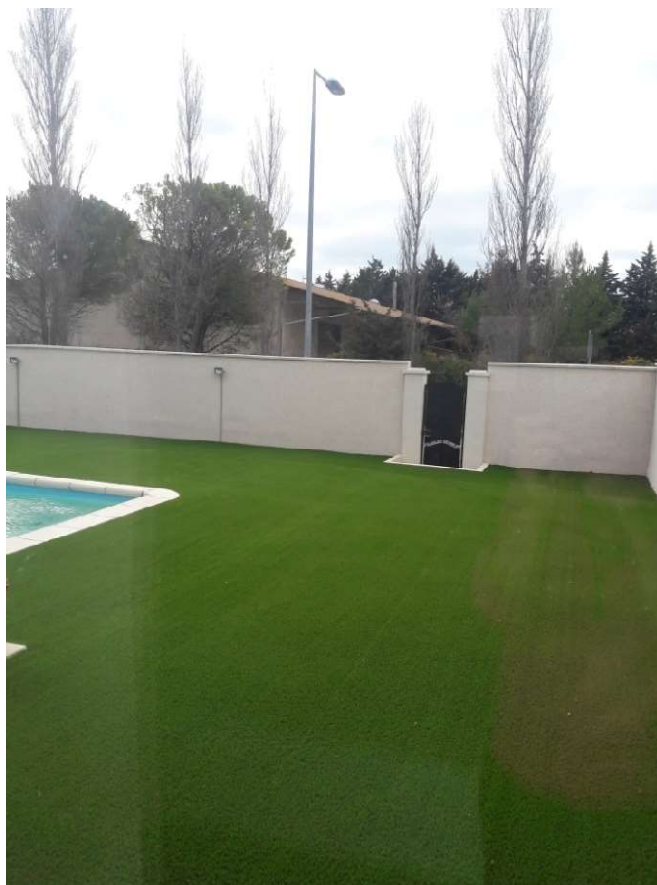
Maison N°3 Vue de la chambre à